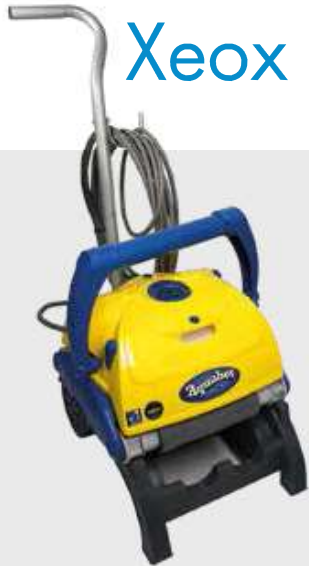
XEOX II INKL. CADDY