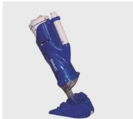
CATFISH ULTRA AKKU

Akkubetriebener Hand- Wassersauger für Pools. Unabhängig von der Filteranlage, wiederaufladbarer Akku im Lieferumfang, wieder verwendbarer Filterbeutel, entfernt Blätter, Sand und Algen, reinigt alle Arten von Pools, sehr geringes Gewicht, leichte Handhabung.